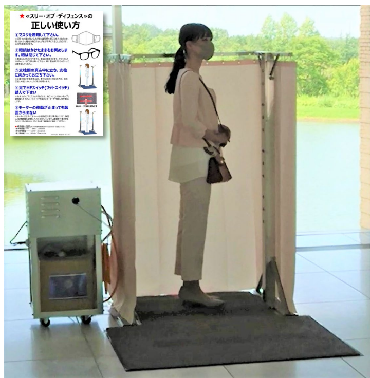
画像は、「スリー・オブ・ディフェンス」SF-1S H1,500mm

★「アミノエリアneo」で新型コロナウイルス (SARS-CoV-2)の不活化を確認しました★